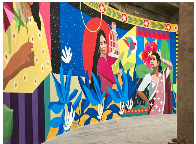
Biennale 2024