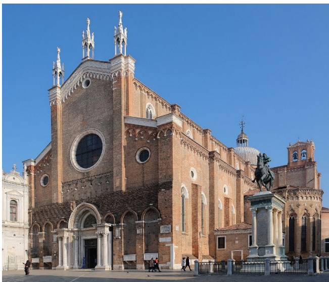
Santi Giovanni e Paolo

Zum Ausklang des Tages werden Sie in einem Restaurant in der Nähe Ihres Hotels zu einem gemeinsamen Abendessen erwartet.