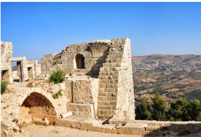
Festung Qala'at er-Rabad

Rückfahrt nach Amman und gemeinsames Abendessen.