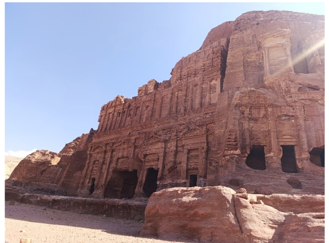
Königswand in Petra

Rückkehr zum Hotel und gemeinsames Abendessen.