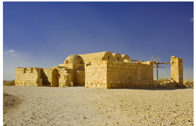
Qasr Amra

Eines der am besten erhaltenen Wüstenschlösser ist das Qasr Kharanah , das schon von weitem sehr gut zu sehen ist und sich majestätisch aus dem Wüstensand erhebt. Nicht weit entfernt besuchen Sie mit Qasr Amra das bekannteste Wüstenschloss; das zum UNESCO-Weltkulturerbe zählt. Besonders beeindruckend sind die Wandmalereien mit ihren detailreichen Darstellungen aus der antiken Mythologie.