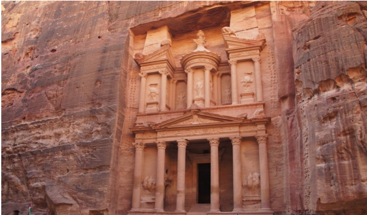
Schatzhaus des Pharaos in Petra

An einem Schnittpunkt zwischen Orient und Okzident , einem Schauplatz antiker und biblischer Überlieferungen, befinden sich die Wurzeln der abendländischen Menschheitsgeschichte . In Jahrtausenden entstand eine von Griechen, Römern und Nabatäern; Juden, Christen und Moslems geprägte Kultur, von der archäologische Funde, Architektur und Kunst bis heute zeugen.