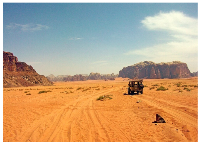
Jeepfahrt im Wadi Rum

Am Vormittag entdecken Sie die majestätische Landschaft des Wadi Rum bei einer Fahrt im Geländewagen. Weite Ebenen aus rostem Sand , bizarr geformte Felsmassive und die endlose Stille der Wüste verleihen der Landschaft eine fast unwirkliche, geradezu außerirdische Schönheit. Folgen Sie noch einmal den Spuren von Thomas Edward Lawrence, dessen Leben im Filmepos „ Lawrence von Arabien “ an diesem Originalschauplatz verfilmt wurde!