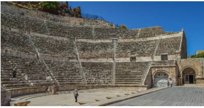
Römisches Theater in Amman CC0 pixabay