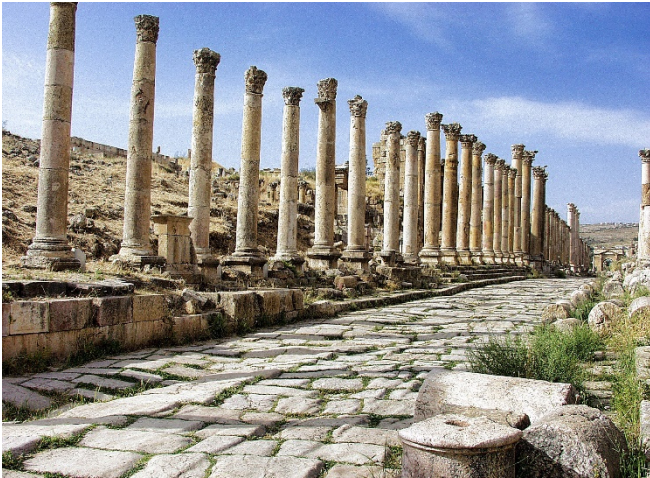
Kolonnadenstraße in Gerasa

Linienflug mit Royal Jordanian von Frankfurt nach Amman (Rail & Fly Bahnreise ab allen deutschen Bahnhöfen auf Anfrage). Nach der Ankunft am Abend erfolgt der Transfer zu Ihrem Hotel in Amman, Standort für die ersten 3 Übernachtungen. Zimmerbezug und Abendessen im Hotel.