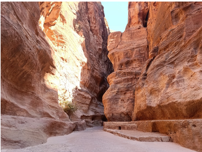
Siq zum Schatzhaus in Petra

Um sich vor Feinden zu schützen, hatten die Nabatäer ihre Stadt tief in das Sandsteingebirge hinein gebaut. Noch heute führt der Hauptzugang durch den von hohen Felswänden gesäumten Siq. Bei Ihrem Gang durch die immer breiter werdende Schlucht sehen Sie einige imposante Felsengräber, darunter das Korinthische Grab sowie ein prunkvolles Treppengrab. Am Ende der gewundenen Schlucht öffnet sich nach und nach der Blick auf das Schatzhaus des Pharaos , das bekannteste Motiv Petras.