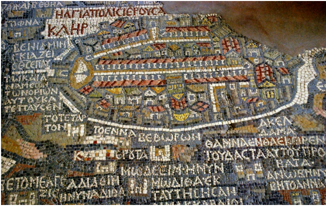
Mosaik in Madaba

Ihr nächstes Ziel ist Umm ar-Rasas , eine bedeutende frühbyzantinische Siedlung, deren Kirchen mit außergewöhnlich gut erhaltenen Bodenmosaiken aufwarten. Besonders das Mosaik der Stephanuskirche zeichnet sich durch seine komplexen christlichen und geometrischen Motive aus und reflektiert die Rolle des Ortes als regionales religiöses Zentrum im 6. Jh.