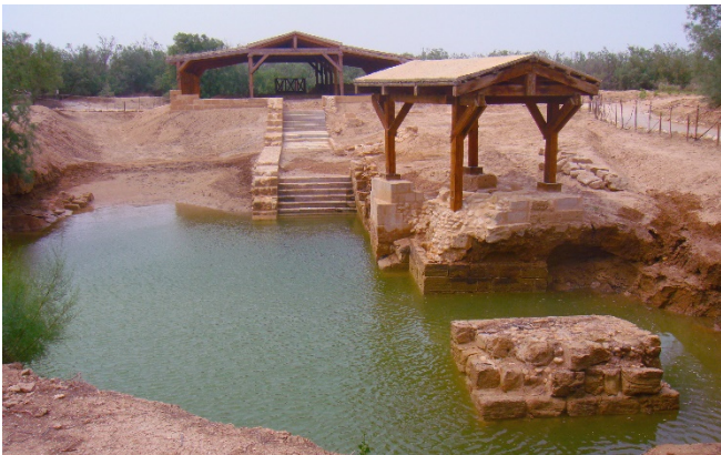
Taufstelle am Jordan

Zimmerbezug für 1 Übernachtung. Bei einem gemeinsamen Abendessen im Hotel bietet sich die Gelegenheit die Eindrücke der letzten Tage Revue passieren zu lassen.