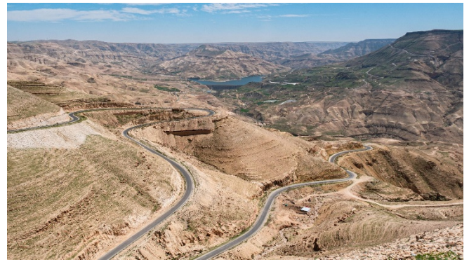
Königsstraße

Am Nachmittag führt Ihre Reise weiter nach Bethanien und Sie besuchen die Stelle am Ufer des Jordan, an der Johannes der Täufer der Überlieferung nach Jesus getauft hat.