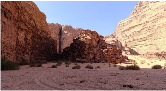
Wadi Rum

Anschließend Weiterreise nach Wadi Musa . Die kleine Stadt liegt unmittelbar am Eingang zu den antiken Stätten von Petra. Zur Einstimmung auf die kommenden Tage besuchen Sie das kleine, aber informative Petra-Museum , das mit faszinierenden Funden und anschaulichen Darstellungen einen ersten Einblick in die Geschichte der Nabatäerstadt bietet.