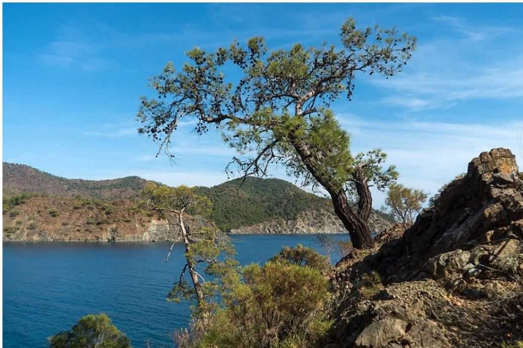
Aussicht vom Lykischen Weg

Über viele Jahrhunderte konnte sich das antike Lykien im Südwesten der heutigen Türkei seine kulturelle und politische Eigenständigkeit unter dem Einfluss wechselnder Herrschaften erhalten. Die Region lag an einer Schnittstelle vieler Hochkulturen , die alle ihre Spuren hinterlassen haben. Davon zeugen zahlreiche archäologische Zeugnisse entlang der malerischen Küste, die durch den lykischen Weg , einem der schönsten Wanderwege an der türkischen Riviera , miteinander verbunden sind.