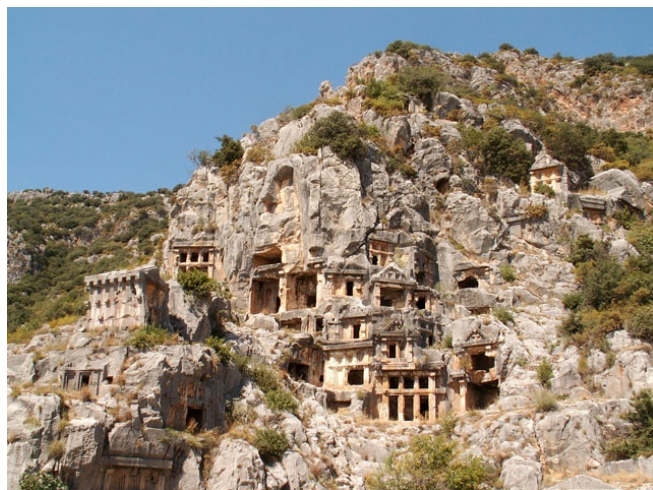
Myra CC0 Simm at-wikimedia.commons

Rückfahrt zum Hotel und gemeinsames Abendessen.