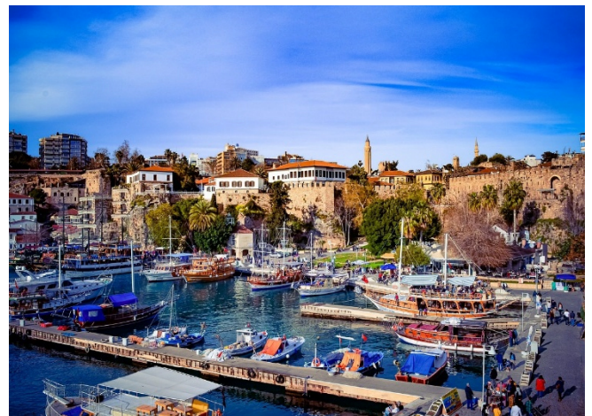
Hafen von Antalya

Fahrt durch das Taurusgebirge zur antiken Stadt Termessos. Während einer leichten Wanderung erkunden Sie die dortige Bergfestung in 1.050 m Höhe. Insbesondere das gut erhaltene antike Theater lohnt den Aufstieg auf die Bergfestung. Die einmalige Höhenlage bietet wunderbare Ausblicke über die bewaldeten und felsigen Gebirgshänge. Bei klarer Sicht kann man in der Ferne sogar das blaue