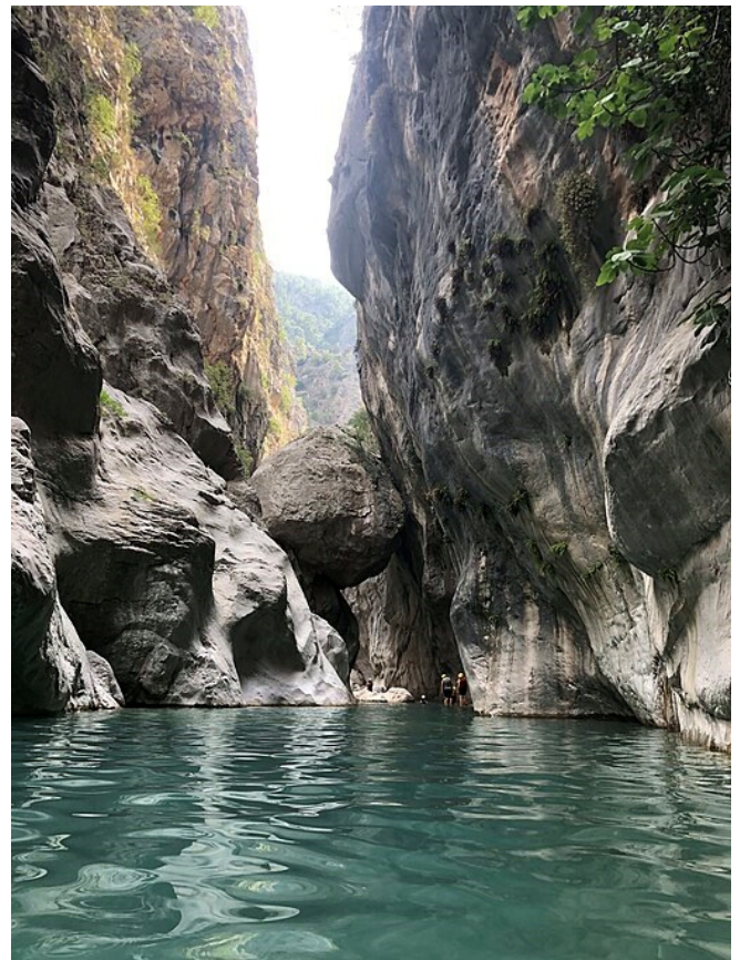
Göynük Canyon

Mittagspause in einem kleinen Lokal in Ulupınar. Die idyllische Lage macht den Aufenthalt unvergesslich.