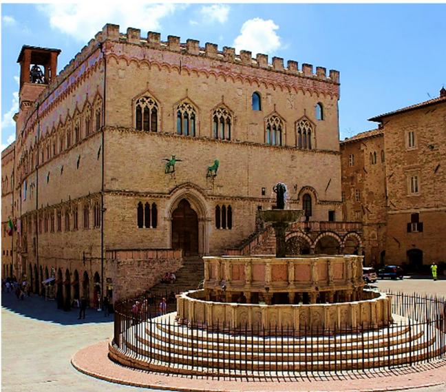
Piazza Grande in Perugia

Nicht weit davon entfernt befindet sich die Kathedrale San Lorenzo . Mit seiner eher schmucklosen Fassade hinterlässt der Dom trotz der fast acht Jahrhunderte währenden Bau- und Umbauzeit den Eindruck, unvollendet geblieben zu sein. Umso sehenswerter ist die Hallenkirche im Inneren mit ihrer reichen Ausstattung .