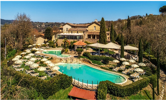
Abbazia Collemedio

Nach dem Zimmerbezug für die kommenden 6 Nächte haben Sie Gelegenheit, Ihr außergewöhnliches Hotel zu entdecken. Das einzigste Kloster erwartet Sie in herrlicher Lage auf einem Hügel mit Blick auf die idyllische Landschaft der Umgebung. Ein perfekter Ort für Erholung und Entspannung inmitten der traumhaften Natur Umbriens. Der erste Tag klingt mit einem gemeinsamen Abendessen im Hotel aus.