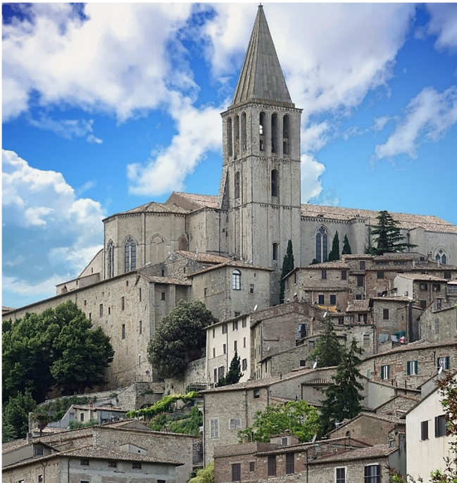
Blick auf Todi

Zum Abschluss Ihres Vormittags in Orvieto führt Sie ein Spaziergang zum Palazzo del Popolo (Außenbesichtigung).