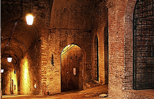
Festung Rocca Paolina in Perugia CC0 Pixabay

Bei Ankunft im Zentrum besuchen Sie die, direkt in der Nähe der Metrostation gelegenen Ruinen des Papstpalastes, Rocca Paolina . Die einstige Festung wurde im 16. Jh. auf Geheiß von Papst Paul III. erbaut und galt bis 1860 als Symbol der päpstlichen Macht über die Stadt.