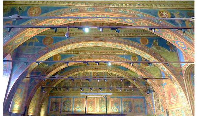
Sala dei Notari im Palazzo dei Priori

Als bedeutende Handelsstadt bot Perugia im Mittelalter die Möglichkeit, verschiedene Währungen zu tauschen .