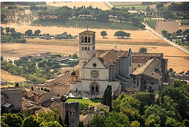
Blick auf die Franziskus-Basilika in Assisi

Mit der großartigen Franziskus-Basilika besichtigen Sie nicht nur ein zentrales Pilgerziel Italiens, sondern auch den Ort, an dem – der Überlieferung nach – Franziskus auf eigenen Wunsch beigesetzt werden wollte. Die steinerne Urne mit seinen Reliquien wird in der Krypta der Unterkirche aufbewahrt.