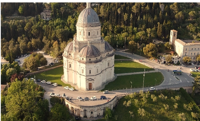
Santa Maria della Consolazione

Der gotische Dom aus dem 12. Jh. , der über einem römischen Apollo-Tempel errichtet wurde, beeindruckt besonders durch die wunderschöne zentrale Rosette an seiner Fassade und das prachtvolle Hauptportal mit ornamentalen Akanthusblättern.