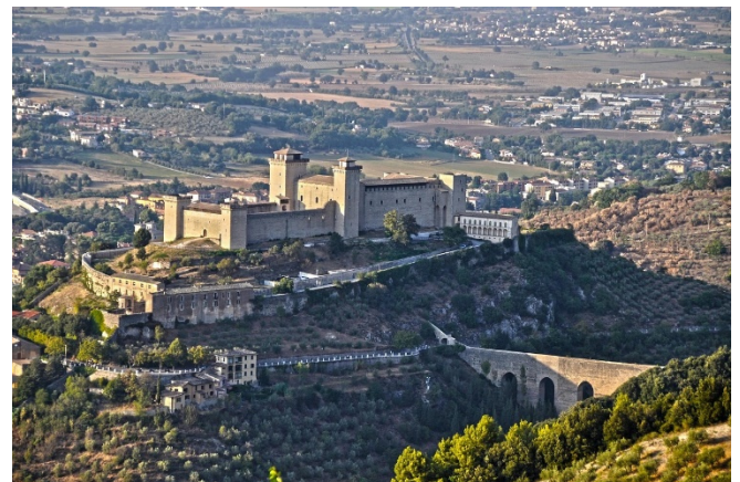
Spoleto mit der Brücke der Türme

Von der Aussichtsterrasse vor der Kirche San Pietro haben Sie einen herrlichen Blick auf die Brücke der Türme , einem 80 Meter hohen Aquädukt.