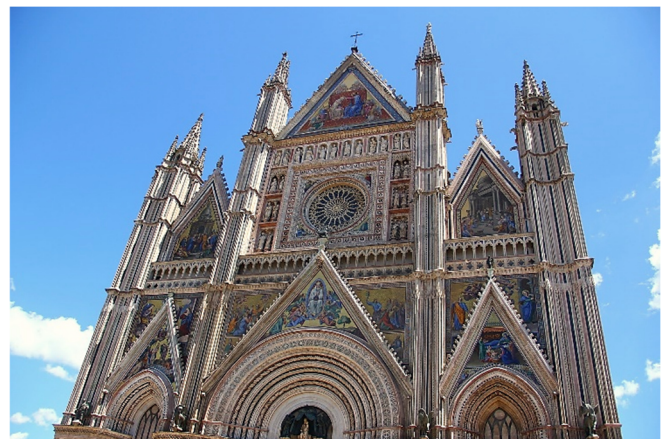
Fassade des Doms zu Orvieto

Nach dem Frühstück starten Sie zur Erkundung des südlichen Teils Umbriens. Die erhaben auf einem Tuffsteinplateau gelegene Stadt Orvieto wurde aufgrund ihrer strategisch günstigen Lage wahrscheinlich schon von den Etruskern gegründet .