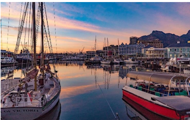
Hafen der Victoria & Albert Waterfront

Rückfahrt zum Hotel und Abendessen an der Victoria & Albert Waterfront , einem historischen Hafenviertel mit einer lebhaften Promenade direkt am Wasser.