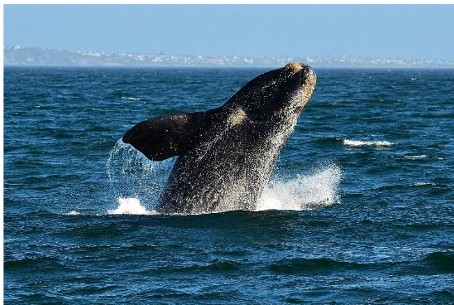
Wale vor Hermanus

Am späten Nachmittag Rückfahrt und gemeinsames Abendessen im Hotel.