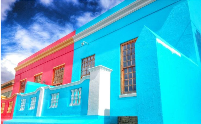
Boo-Kaap-Viertel CCBYSA4.0. Nkansahreford at-wikimedia.commons

Individuelle Anreise zum Flughafen, wo Sie Ihr Fachleiter erwartet. Am späten Abend gemeinsamer Linienflug mit Lufthansa von Frankfurt nach Kapstadt (Rail & Fly-Bahnreise auf Anfrage).