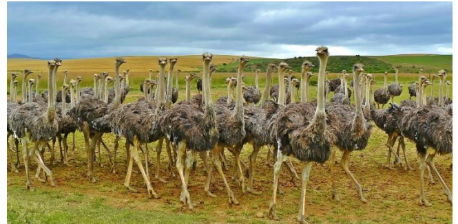
Herde von Straußen

Gemeinsames Abendessen auf der Farm. Fahrt zum Hotel und Zimmerbezug für 1 Übernachtung.