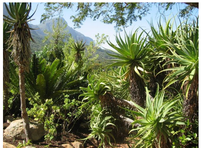
Botanischer Garten Kirstenbosch

Rückfahrt und gemeinsames Abendessen im Hotel.