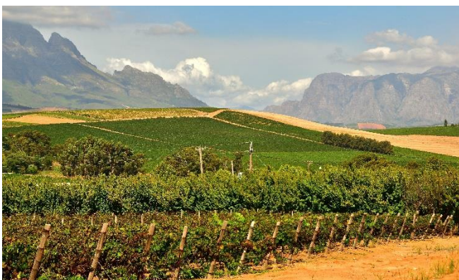
Weinberge in Südafrika CC0 pixabay

Zimmerbezug für 1 Übernachtung und gemeinsames Abendessen im Hotel.