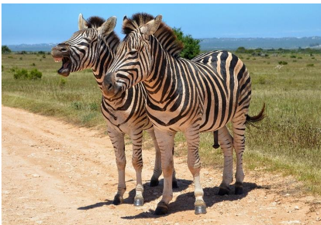
Zebras am Straßenrand

Am Nachmittag erfolgt der Transfer zum Flughafen von Kapstadt. Rückflug nach Deutschland.