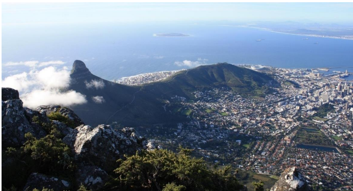
Blick auf Kapstadt

Am südlichen Ende Afrikas, wo sich Atlantik und Indischer Ozean treffen, erwarten Sie spektakuläre Landschaften , ein reiches multikulturelles Erbe und eine einzigartige Tier- und Pflanzenwelt . Von den zerklüfteten Küsten am Kap der Guten Hoffnung, über die beschaulichen Weinberge der Kap-Provinz, bis zu den weiten Savannen der Eastern Cape-Region, zeugen Städte, Nationalparks und historische Stätten von einer bewegten Geschichte . Eine der schönsten Panoramastraßen der Welt ist die Garden Route entlang Südafrikas traumhafter Südküste.