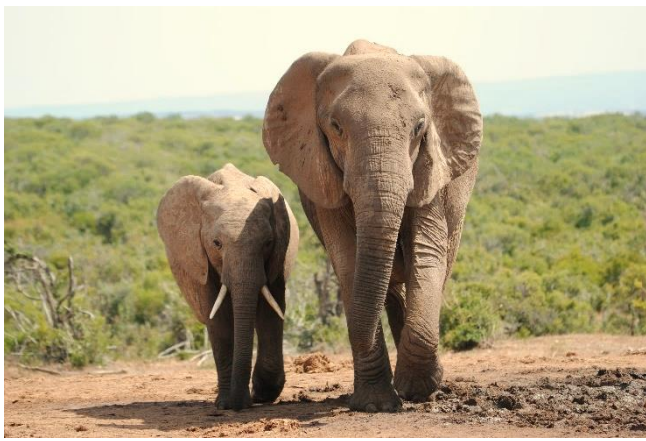
Elefantenkuh mit Kalb

Aus offenen Safarifahrzeugen aus haben Sie die Möglichkeit, die Tierwelt in ihrer natürlichen Umgebung zu beobachten. Die Elefantenherden, nach denen der Park benannt ist, stehen im Mittelpunkt. Daneben lassen sich Büffel, Zebras, Löwen, Warzenschweine und Nashörner beobachten. Insgesamt leben hier über 600 Säugetierarten. Die abwechslungsreiche Landschaft reicht von dornigen Buschlandschaften über offene Grasflächen bis hin zu sanften Hügeln und kleinen Flussläufen. Diese Bedingungen bieten gute Voraussetzungen für Sichtungen.