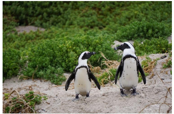
Pinguine am Boulders Beach