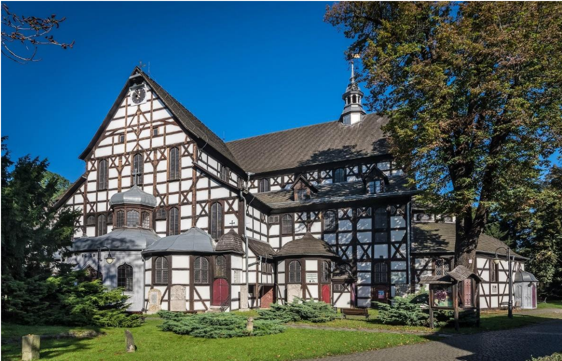
Friedenskirche in Schweidnitz

Im Herzen Europas bietet das historische Niederschlesien eine Fülle interessanter Sehenswürdigkeiten, die von einer langen und bewegten Geschichte erzählen. Schon immer war die Region eine Drehscheibe zwischen Ost und West , die im Laufe der Jahrhunderte mal zu Preußen, mal zu Böhmen, mal zu Habsburg und schließlich zu Polen gehörte. So entstand im Schatten des Riesengebirges eine reiche und vielschichtige Kultur .