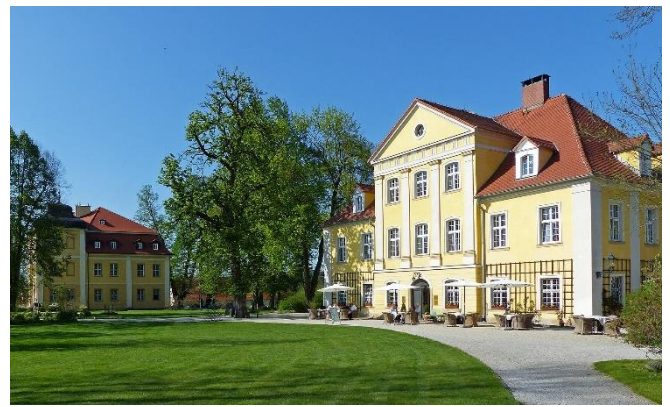
Schloss Lomnitz

Nach der Rückfahrt nach Breslau gestalten Sie den Abend und das Abendessen in Eigenregie.