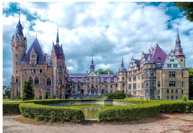
Schloss Moschen

Am Vormittag fahren Sie zum Schloss Moschen , das der Legende nach eine Gründung der Tempelritter gewesen sein soll. Das heutige Aussehen verdankt die Anlage dem Magnaten Hubert von Thiele-Winkler , dessen Familie im 19. Jh. zu Reichtum und Ansehen gelangte und die ursprünglich barocke Residenz im Stil des Historismus umbauen und erweitern ließ. Das Schloss soll 99 Türme und 365 Zimmer besitzen. Im Rahmen einer Führung sehen Sie die öffentlich zugänglichen Bereiche und hören von der wechselvollen Geschichte.