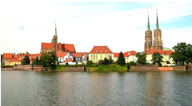
Silhouette der Dom- und Sandinsel

Nur wenige Schritte entfernt erhebt sich mit der unscheinbaren Kirche St. Ägidien , das älteste erhaltene Gebäude der Stadt. Von Licht durchflutet begrüßt Sie die Backsteinkirche Maria auf dem Sande . Auf den schlanken und hohen Säulen des Mittelschiffs ruht ein eindrucksvolles Sternengewölbe.