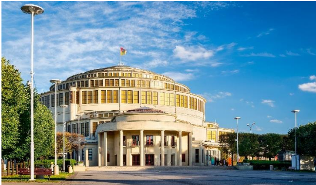
Jahrhunderthalle in Breslau

Mit einem gemeinsamen Abendessen im Hotel klingt der Tag aus.