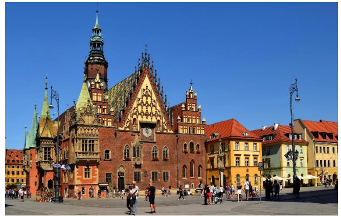
Altes Rathaus am Rynek

Nach einer individuellen Mittagspause erkunden Sie bei einem gemeinsamen Spaziergang das historische Zentrum von Breslau. Ausgangspunkt ist der Rynek, der glanzvoll restaurierte Ringplatz im Herzen der Stadt . Sie blicken auf die Fassaden stolzer Bürgerhäuser und sehen das Alte Rathaus mit seinen markanten Giebeln (Außenbesichtigung).