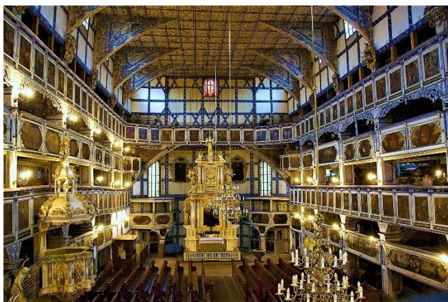
Friedenskirche in Jauer

Zum Auftakt besichtigen Sie die Friedenskirche in Jauer (Jawor) , die mehr als 5500 Gläubigen Platz bot. Die Malereien an den Emporen zeigen Szenen aus dem Alten und Neuen Testament sowie Wappen des regionalen Adels.