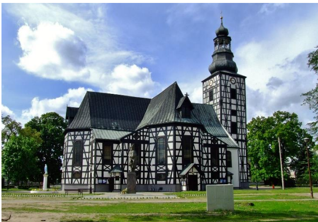
Gnadenkirche zum Heiligen Kreuz

Anschließend fahren Sie weiter nach Militsch (Milicz) . Erstmals erwähnt im Jahr 1136 entwickelte sich aus einer Burg eine Siedlung, in der seit dem 15. Jh. viele Bauern aus Schwaben angesiedelt wurden. In seiner Eigenschaft als König von Böhmen erlaubte Kaiser Joseph I. in Militsch den Bau einer von insgesamt sechs evangelischen Gnadenkirchen in Schlesien, die in den Jahren 1709 bis 1714 als Fachwerkbau errichtet wurde.