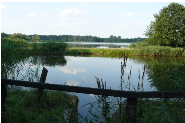
Teichlandschaft im Bartschtal

Rückfahrt nach Breslau und gemeinsames Abendessen im Hotel.