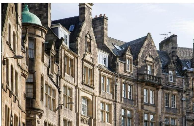
Georgianische Häuser in New Town

Am Vormittag unternehmen Sie einen Ausflug mit der Straßenbahn zur königlichen Yacht Britannia, die seit einigen Jahren im Hafen der Stadt vor Anker liegt. Das elegant ausgestattete Schiff diente der englischen