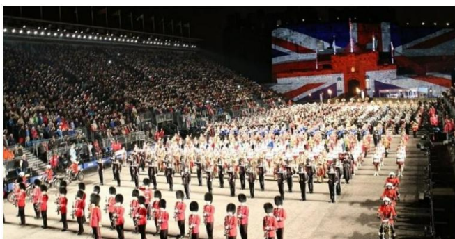
Military Tattoo

Nach dem Frühstück starten Sie zu einem Ausflug in den Süden von Edinburgh, zu den Scottish Borders . Die sanften Hügel dieser wunderschönen Landschaft bilden die Grenze zwischen Schottland und England. Diese Region ist vor allem durch ihre vier mächtigen mittelalterlichen Abteien bekannt, die heute nur noch als eindrucksvolle Ruinen erhalten sind. Ein Juwel werden Sie besuchen, die bekannte Melrose Abbey (HES) , einst das bedeutendste Kloster der Region. Schon Theodor Fontane schrieb über sie: „Und willst du des Zaubers sicher sein, so besuche Melrose bei Mondschein“. Doch auch bei Tageslicht wird die Abtei Sie in ihren Bann ziehen.