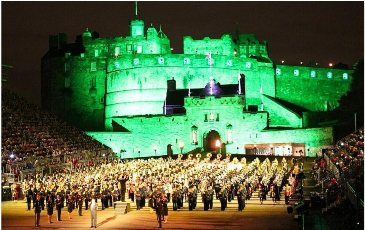
Military Tattoo

Die Hauptstadt Schottlands fasziniert mit ihrem einzigartigen Flair, das Tradition, lebendiges Treiben und beeindruckende Architektur vereint. Verwinkelte Gassen, historische Plätze und das imposante Edinburgh Castle , das hoch über der Stadt thront, prägen das Bild, das sich Ihnen bietet. Wie ein Rückgrat bildet die Royal Mile die zentrale Achse und verbindet das Schloss mit dem am Fuße des Hügels liegenden Holyroodhouse sowie weiteren bedeutenden Sehenswürdigkeiten.