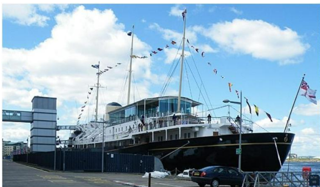
Royal Britannia

Königsfamilie über Jahrzehnte als schwimmender Palast und bereiste die Weltmeere als Botschafterin des Vereinigten Königreichs. Bei einem Rundgang durch die noblen Räumlichkeiten wird Geschichte lebendig.