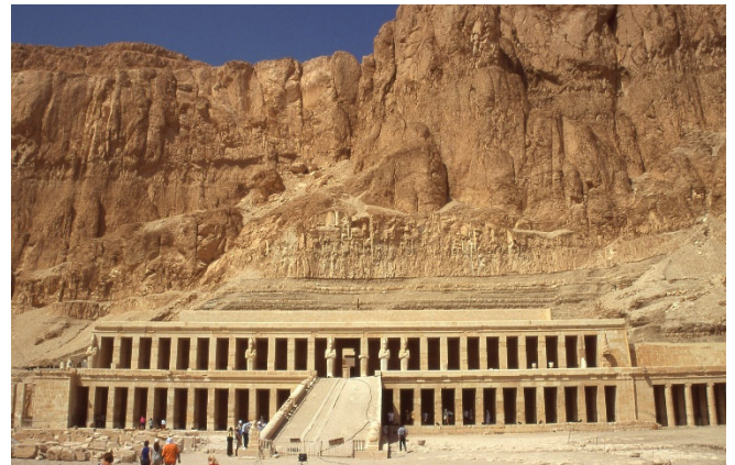
Tempel der Hatshepsut