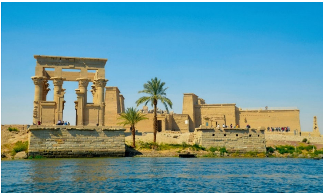
Isis-Tempel auf der Insel Philae

Noch immer prägt der Nil, Afrikas längster Fluss, Lebensspender und Wasserstraße zugleich, das sagenumwobene Land der Pharaonen . Hier entstand in Jahrtausenden eine Kultur, deren Bauwerke und Geheimnisse die Menschen seit jeher faszinieren.