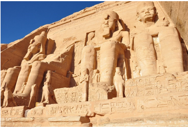
Abu Simbel