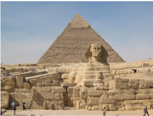
Sphinx und Cheops-Pyramide

Der heutige Tag führt Sie zu den nahe gelegenen Kultstätten des „Alten Reiches“. Vor 3500 bis 5000 Jahren herrschten mächtige Pharaonen über das ägyptische Volk. Inmitten der Wüste errichteten sie imposante Bauwerke, Skulpturen und Gräber und schufen damit ein Vermächtnis für die Ewigkeit.