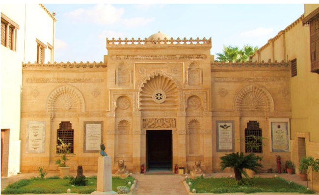
Koptisches Museum

Nach dem Zimmerbezug für zwei Übernachtungen klingt der Tag mit einem gemeinsamen Abendessen aus.