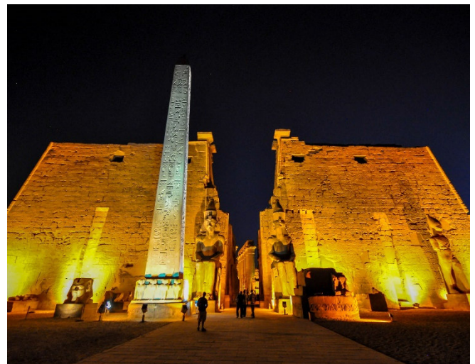
Luxor bei Nacht

In Deir el-Medina lebten die Arbeiter und Künstler, die die Grabanlagen in die Felsen schlugen und ausgestalteten. Am Rande der antiken Wohnsiedlung bauten die Einwohner in ihrer Freizeit eigene Gräber für sich und ihre Familien, die ebenfalls prachtvoll ausgemalt sind. Anschließend Besichtigung von Medinet Habu , dem Totentempel Ramses III. mit reliefgeschmückten Wänden zu Siegen, Opferzeremonien und Totenkult.