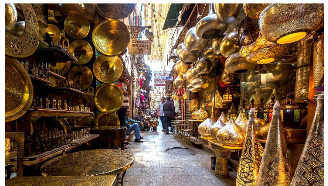
Khan el-Khalili-Basar

Anschließend bummeln Sie durch den farbenfrohen Khan el-Khalili-Basar . Der traditionelle Handlungsmarkt wurde bereits im 14. Jh. gegründet und bietet eine Fülle verschiedenster Waren. Zum Ausklang des Tages werden Sie in einem Restaurant zu einem gemeinsamen Abendessen erwartet. Rückfahrt zum Hotel.