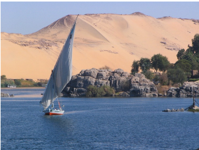
Feluke bei Assuan

Danach sehen Sie bei einer Busrundfahrt den beeindruckenden Hochdamm des Nasser-Stausees und besuchen die altägyptischen Granitsteinbrüche . Ein gewaltiger, unvollendet gebliebener Obelisk erinnert daran, dass hier seit der Zeit der Pharaonen Granitblöcke für deren Monumentalbauten gebrochen wurden.