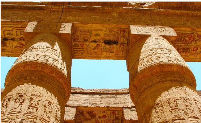
Tempel von Karnak

Gegen Mittag Rückkehr zum Schiff. Während eines gemeinsamen Mittagessens heißt es „ Leinen los “ und Ihre Nilkreuzfahrt beginnt mit Kurs auf Esna. An Ihnen vorbei zieht die fruchtbare Niloase und es bleibt ausreichend Zeit, die Landschaftseindrücke in aller Ruhe zu genießen. Nach dem Abendessen an Bord bleibt das Schiff über der Nacht in Esna.