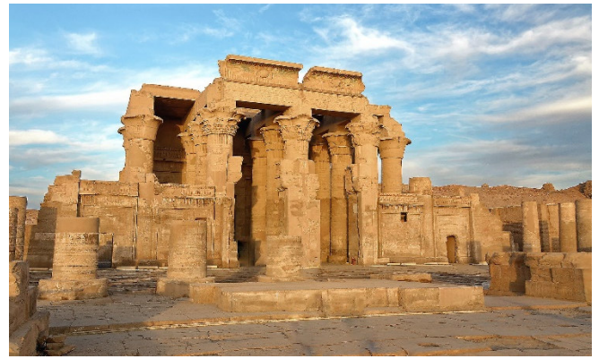
Kom Ombo