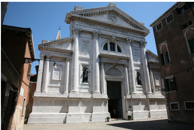
San Francesco alla Vigna

Am Nachmittag besuchen Sie die weniger bekannte Franziskanerkirche San Francesco alla Vigna , deren Fassade ein Werk Andrea Palladios ist. Das Gotteshaus, dessen Geschichte eng mit der Familie Grimani verbunden ist, beherbergt wertvolle Kunstwerke von Veronese, Bellini und Pietro Lombardo .