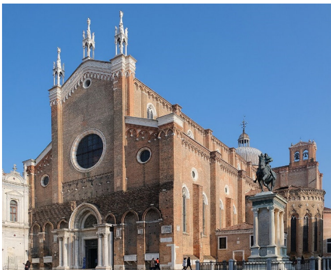
Santi Giovanni e Paolo

Zum Ausklang des Tages werden Sie in einem Restaurant in der Nähe Ihres Hotels zu einem gemeinsamen Abendessen erwartet.