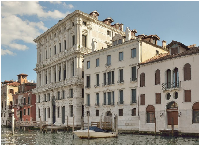
Fondazione Prada