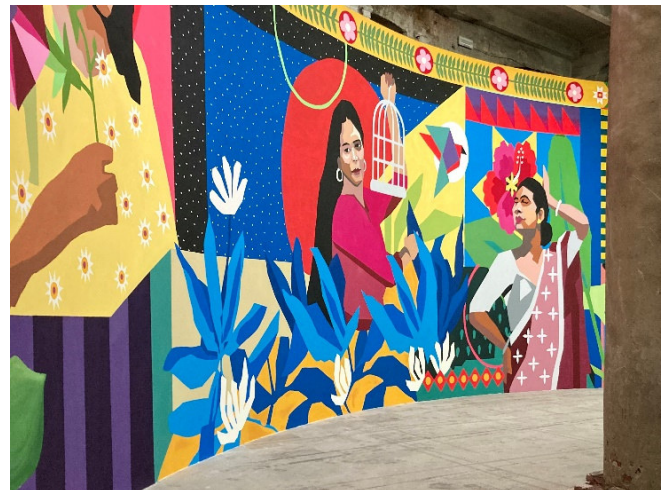
Biennale 2024