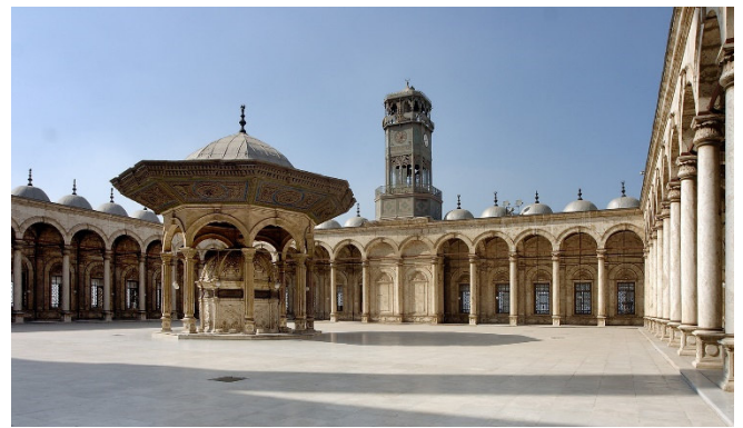
Innenhof der Muhammad-Ali-Moschee

Weithin sichtbar oberhalb des Stadtzentrums erhebt sich auf einer Anhöhe die Zitadelle von Saladin . Von der Festungsanlage, deren ältesten Teile aus dem 12. Jh. stammen, bietet sich ein herrlicher Panoramablick. Im Inneren der wehrhaften Anlage befindet sich die Muhammad-Ali-Moschee mit ihren zwei markanten Minaretten, die zu den bekanntesten Wahrzeichen Kairos gehören. Vom arkadengesäumten Innenhof betreten Sie den Gebetsraum, dessen Wände mit Alabaster verkleidet sind.