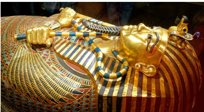
Sarkophag des Tutanchamun