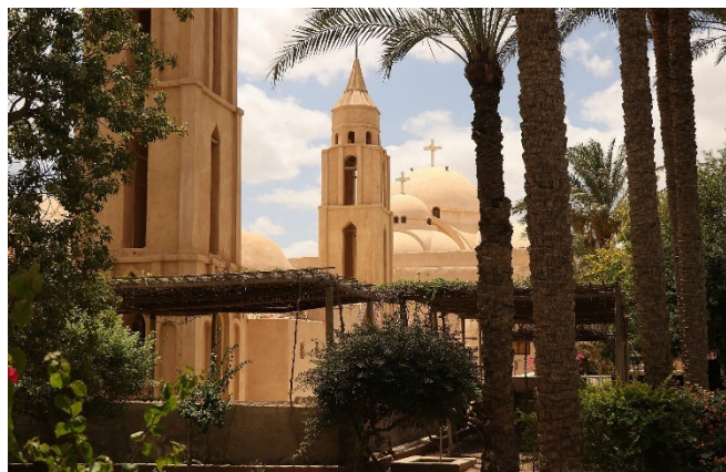
Kloster des hl. Makarios

Am Abend Ankunft in Alexandria und Zimmerbezug für 2 Übernachtungen. Gemeinsames Abendessen im Hotel.