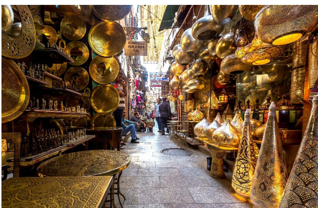
Khan el-Khalili-Basar

Anschließend bummeln Sie durch den farnefrohen Khan el-Khalili-Basar . Der traditionelle Handelsmarkt wurde bereits im 14. Jh. gegründet und bietet eine Fülle verschiedenster Waren.