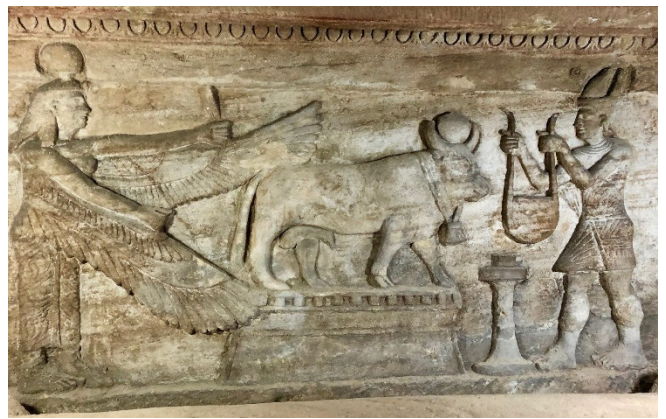
Katakomben von Kom el-Schukafa

Erstes Ziel Ihrer Stadtbesichtigungen ist die am Hafen liegende Qaitbay-Zitadelle , die im 15. Jahrhundert auf den Ruinen des antiken Leuchtturms von Pharos erbaut wurde. Mit einer Höhe von mehr als 120 m galt er als eines sieben Weltwunder der Antike. Vom Dach der imposanten Festung bietet sich ein wunderbarer Panoramablick.