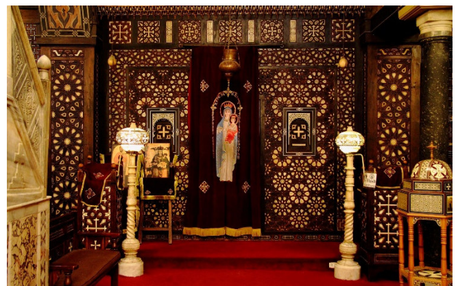
Hängende Kirche CCBYSA4.0 Djehouty at-wikimedia.commons

Zum Abendessen werden Sie in einem traditionellen Restaurant erwartet. Freuen Sie sich auf die Vielfalt der orientalischen Küche !