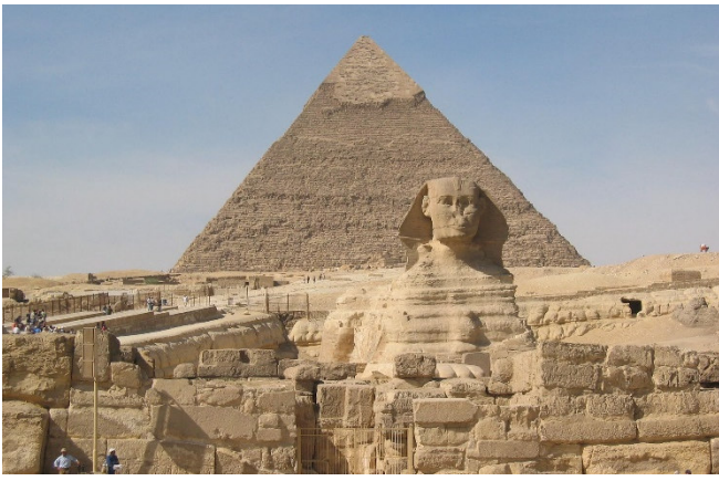
Sphinx und Cheops-Pyramide

Am Nachmittag fahren Sie zurück ins Nildelta und erreichen am Abend Ihr Hotel in Gizeh. Nach dem Zimmerbezug für 3 Übernachtungen klingt der Tag mit einem gemeinsamen Abendessen im Hotel aus.