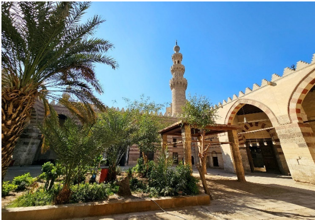
Islamisches Kairo CCBY2.0 Richard Mortal at-flickr

Gemeinsamer Flug mit Eurowings von Düsseldorf nach Kairo mit Ankunft am frühen Abend (andere Abflughäfen auf Anfrage). Nachdem die Einreiseformalitäten erledigt sind, begrüßt Sie Ihre örtliche Reiseleitung und begleitet Sie auf dem Transfer zu Ihrem Hotel im Zentrum von Kairo. Nach dem Zimmerbezug für 2 Übernachtungen klingt der Tag mit einem gemeinsamen Abendessen im Hotel aus.