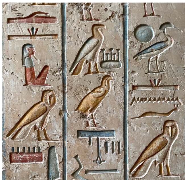
Hieroglyphen CC0 pixabay

Alt-Kairo CCBYSA4.0 Djehouty at-wikimedia.commons Statue Ramses II. CCBYSA4.0 Holger Uwe Schmitt at-wikimedia.commons Qaitbay-Zitadelle CC0 pixabay