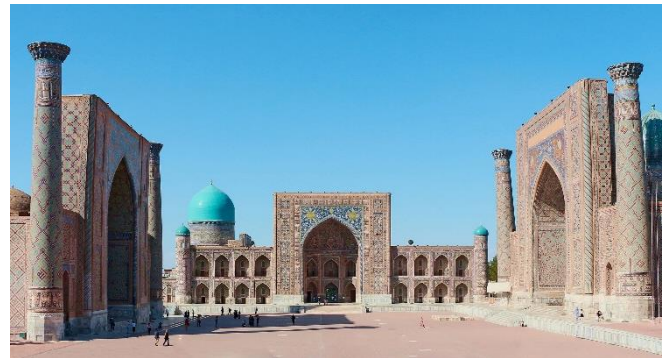
Registan

Mit einem modernen und komfortablen Zug fahren Sie am Morgen nach Samarkand, eines der ältesten Kulturzentren der Welt . Von hier herrschte der Mongolenführer Timur im 14. Jh. über ein Reich, das so groß war, wie das Alexanders des Großen. Unter seiner Herrschaft wurde Samarkand Hauptstadt und genoss den Ruf, die schönste und wichtigste Stadt der alten Welt zu sein. Reger Handel führte Reisende und Kaufleute hierher und bescherte der Stadt Reichtum und Wohlstand. Noch heute spiegelt sich dies in den Gebäuden der Altstadt wider, die wie ein stein-gewordenes Märchen aus 1001 Nacht wirken.