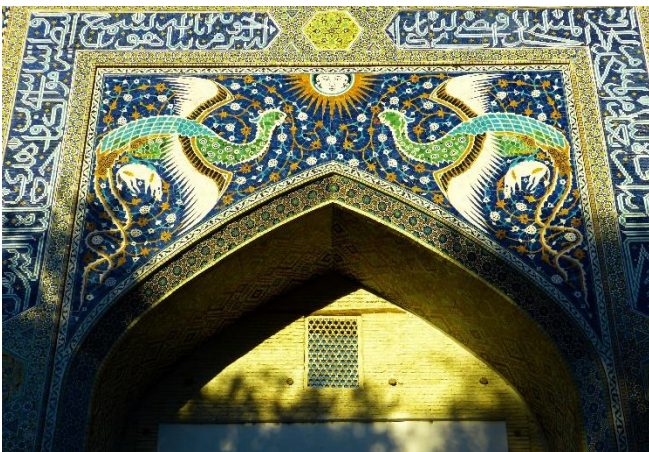
Medrese Nadir-Divan-Begi

Lassen Sie sich faszinieren von der Pracht und Anordnung der blau und türkis gekachelten Medrese Kukeldasch , dem ältesten Gebäude am Labi Chaus, der Medrese Nadir-Divan-Begi und der Chanaka Nadir-Divan-Begi , einer ehemaligen Pilgerunterkunft. Im Anschluss haben Sie Gelegenheit, sich mit einem der bekanntesten Puppenspieler Bucharas in seiner Marionetten-Manufaktur zu unterhalten.