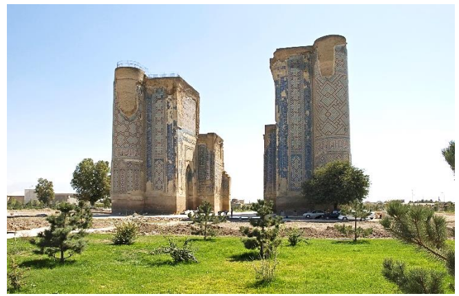
Ak-Saray-Palast

Über den Gebirgspass Tachta Karatscha führt die Reise weiter nach Schachrisabz der legendären Geburtsstadt Timurs. Sie zählt den frühen Zentren seiner Herrschaft . Gegründet wurde die als grüne Stadt bekannte Siedlung bereits im 3. Jh. v. Chr. Im 14. Jh. entstanden unter dem ehrgeizigen Mongolenfürsten eindrucksvolle Bauten, die er mit einer 11 m hohen und bis zu 5 m dicken Mauer befestigen ließ.