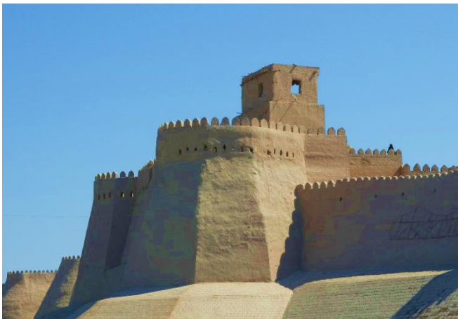
Chiwa CCBYSA4.0 Gregor Rom at-wikimedia.commons

Besonders eindrucksvoll erhebt sich das unvollendet gebliebene, türkis schimmernde Minarett Kalta-Minor , dessen mächtige Erscheinung bis heute das Stadtbild prägt. In der Nähe befindet sich mit dem Kunja-Ark-Palast die ehemalige Residenz der Khane, ein Ort höfischer Macht und repräsentativer Architektur.