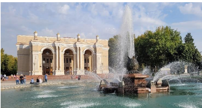
Alisher-Navoi Theater

Überraschen wird Sie die Verbindung von traditionellem Flair und monumentalen, neuzeitlichen Bauwerken! Denn längst hat sich Taschkent in eine moderne Metropole mit europäischen und asiatischen Einflüssen gewandelt. Vom Einfluss sowjetischer Herrschaft zeugen u. a. das Alisher-Navoi Theater und das Opernhaus von Taschkent , das vom Stararchitekten Alexei Schtschussew entworfen wurde (Außenbesichtigungen).