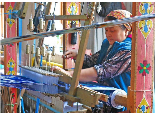
Seidenverarbeitung in Margilan

Der heutige Tag steht ganz im Zeichen der Seide . Das Klima der Region bietet die idealen Voraussetzungen für die Zucht von Seidenraupen. In Margilan besuchen Sie eine Seidenmanufaktur.