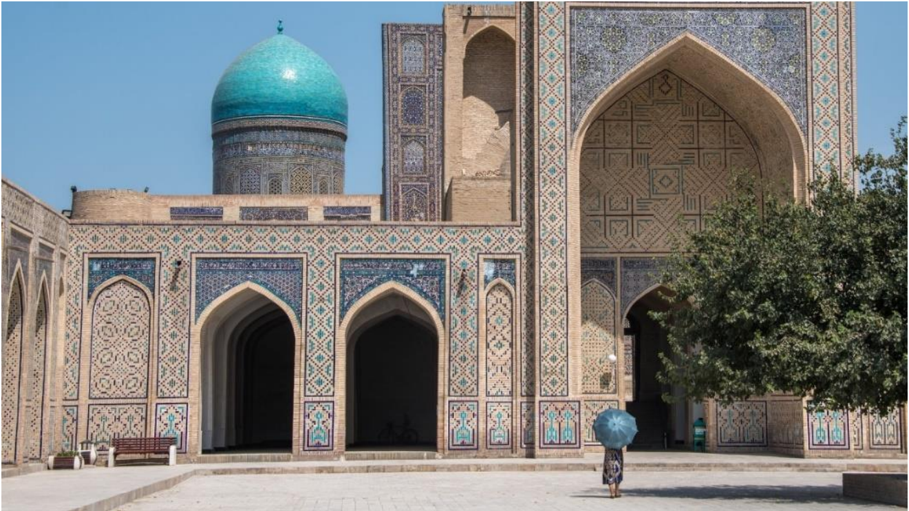
Kalyan-Moschee in Buchara