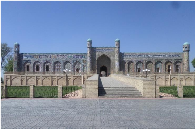
Palast des Khudayar-Khan

Der Palast des Khudoyar Khan ist ein schönes Beispiel für die glanzvollen königlichen Residenzen in der Geschichte Zentralasiens. Das bemerkenswerte Gebäude mit seiner 70 m hohen, mit farbenprächtigen Fliesen und Ornamenten geschmückten Fassade, bewahrt die Erinnerung an den letzten Herrscher des Kokand Khanats.