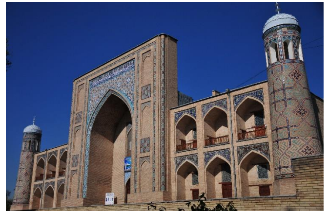
Medrese Kukaldash

Mit einem gemeinsamen Abendessen in einem Restaurant klingt der Tag aus.