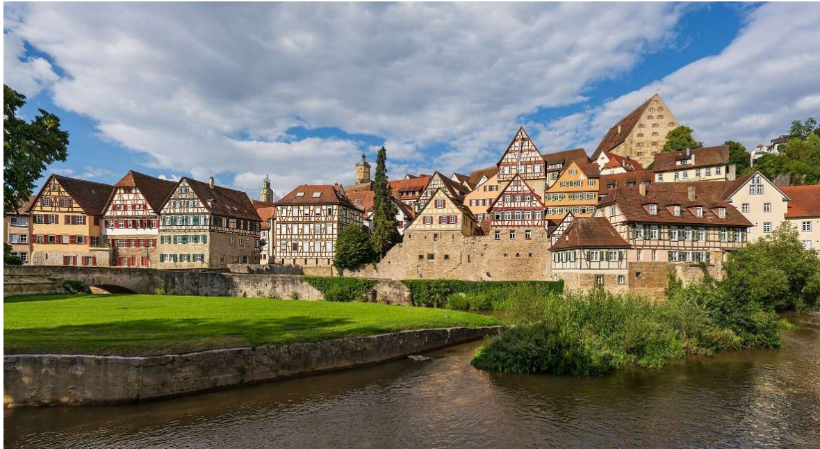
Schwäbisch Hall

Im Norden von Baden-Württemberg erwartet Sie mit dem Hohenloher Land eine Region wie aus dem Bilderbuch , die Eduard Mörike als „ besonders zärtlich ausgeformte Hand Deutschlands “ beschrieb. Die Flüsse Jagst, Tauber und Kocher schlängeln sich durch eine idyllische Landschaft mit sanften Hügeln, saftigen Wiesen und scheinbar endlosen Feldern.