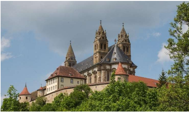
Kloster Großcomburg

Bei einer Führung bewundern Sie mit dem großen Radleuchter und dem vergoldeten Antependium zwei wertvolle Schätze mittelalterlicher Handwerkskunst.