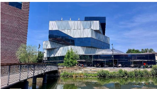
experimenta Heilbronn CCBYSA4.0 5R-MFT at-wikimedia.commons

Nach einer individuellen Mittagspause im hauseigenen Restaurant werden Sie zu einer informativen Führung durch die Ausstellungsbereiche „Entdeckerwelten“ und „Erlebniselten“ erwartet. Dabei ergeben sich auch spannende Einblicke in die außergewöhnliche Architektur des Gebäudes.