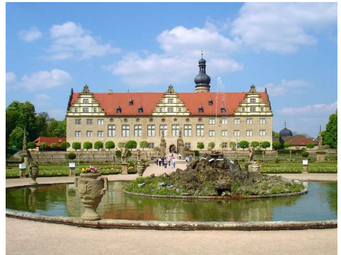
Schloss Weikersheim

Nur wenige Kilometer entfernt liegt im Taubertal Schloss Weikersheim . Auf den Mauern einer mittelalterlichen Wasserburg errichteten die Grafen von Hohenlohe am Ende des 16. Jahrhunderts eine prachtvolle Anlage im Stil der Renaissance , deren dreieckiger Grundriss architektonisch einzigartig ist. In dieser Zeit entstand auch der Saalbau mit dem Rittersaal und die Gartenfassade mit ihren markanten Giebeln. Im Anschluss an Ihre Schlossführung bietet sich die Gelegenheit zu einem Spaziergang durch den wunderschön angelegten Park.