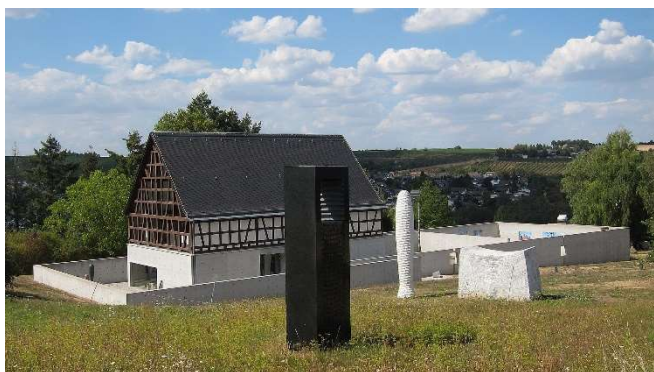
Fondation Kubach-Wilmsen CCBYSA4.0 Stefan Oemisch at-wikimedia.commons

Weiterfahrt durch die Pfalz und Rheinhessen nach Bad Kreuznach im Nahetal , wo Sie in einem ausgesuchten Restaurant zu einem gemeinsamen Mittagessen erwartet werden.