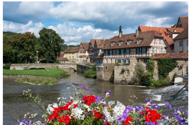
Schwäbisch Hall

Am Abend Ankunft in Ihrem komfortablen Standort-hotel in Schwäbisch Hall . Sie wohnen im Ringhotel Hohenlohe , einem Gebäudeensemble direkt am Ufer des Kochers mit Schwimmbad und Wellnessbereich. Die Altstadt erreichen Sie nach einem kurzen Spaziergang über die nahe Henkersbrücke. Nach dem Zimmerbezug für 3 Übernachtungen klingt der Tag mit einem gemeinsamen Abendessen aus.